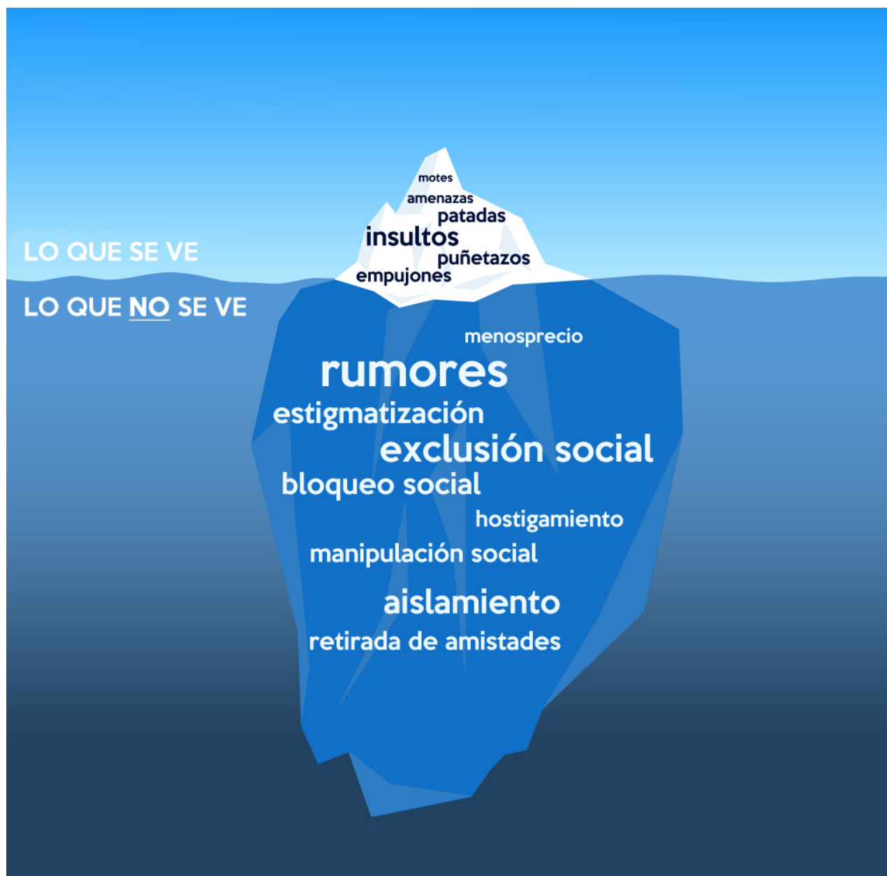
Imagen: Iceberg del Acoso Escolar

los referentes de éxito a partir de la ilegalidad, el abuso, la corrupción y la impunidad, entre otros, que debemos observar con sinceridad como mexicanas y mexicanos.